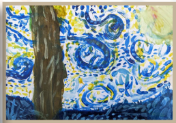
貝殼杉班 張之寧- 梵谷-《星夜》