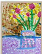
貝殼杉班 王晴萱- 我的向日葵