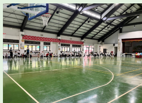
全校體育活動 - 漸進式耐力跑