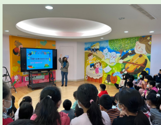
四年級圖書館利用教育