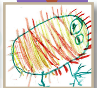
油桐花班 柯穆善- 和家人去海邊