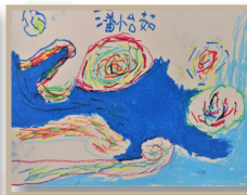
鹿角樹班 潘怡茹- 梵谷繪畫創作