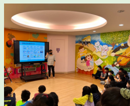
三年級圖書館利用教育