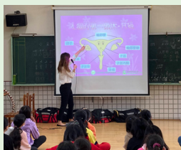
高年級女生性教育宣導