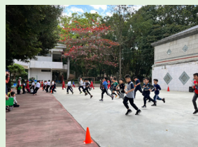
全校體育活動 (漸進式耐力跑)