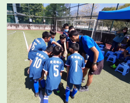
國小足球世界盃南投縣初賽