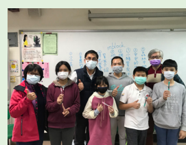
週三科技營隊成果發表