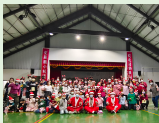
英語手牽手 - 聖誕節活動