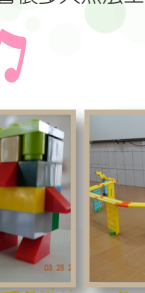
鹿角樹班 陳妍儒、黃子瑄- 軌道