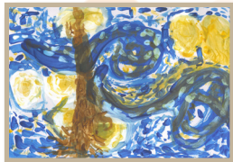
貝殼杉班 李承翰- 梵谷-《星夜》