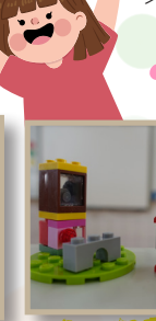
鹿角樹班 張益瑞- 扭蛋機、企鵝