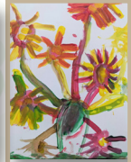
貝殼杉班 辛采昕- 我的向日葵