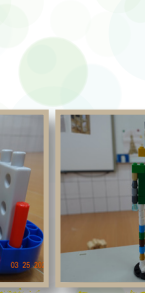
鹿角樹班 蕭倩桐- 警笛頭