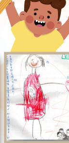
油桐花班 游玄翎- 媽媽的肚子裡有弟弟