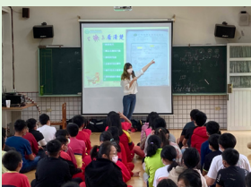
高年級全民健保及用藥安全宣導