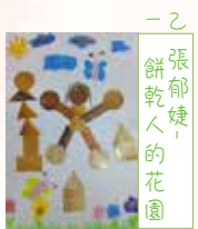
一乙 張郁婕， 餅乾人的花園