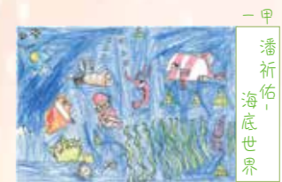
一甲 潘祈佑， 海底世界