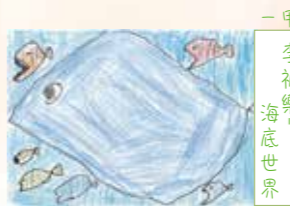
一甲 李祈樂， 海底世界