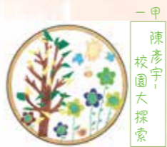
一甲 陳彥宇， 校園大探索