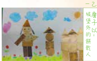
一乙 詹子以， 餅乾人的花園