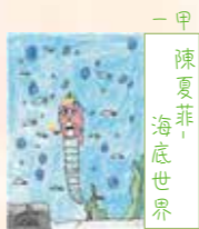
一甲 陳夏菲， 海底世界