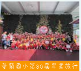
愛蘭國小第80屆畢業旅行