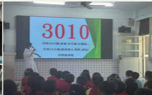
視力與口腔衛生宣導