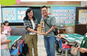
家長會會長送教師節禮物