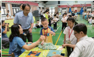
114學年度小一迎新活動