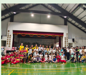
英語手牽手 兒童節活動