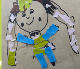
鹿角樹 - 羅勃·米姬 拼貼自畫像