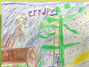
油桐花 - 潘苡恩 《唧伊答》