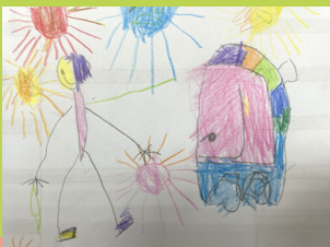
油桐花 - 陳宥均 在太陽下推車好熱！