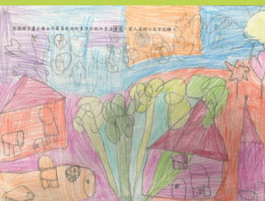
油桐花 - 全芃蓁 《唧伊答》- 花朵上有房子