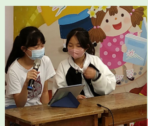
六年級 圖書館利用教育