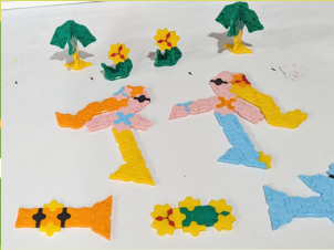
鹿角樹 - 壽姿伶 LaQ 海洋世界

約翰森·里根說：生命中的挑戰不是要讓你陷入停頓，而是要幫助你發現自我。」的確，人生中有許多挫折與失敗，但你不能就此放棄，因為這樣才能追求夢想；如果你放棄，就等於是放棄了自己的人生；你要打敗挫折和失敗，才能朝著夢想前進。