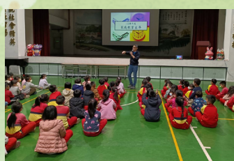
一、二年級家庭教育 宣導