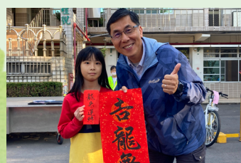
期末學生頒獎摸彩活動