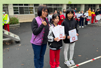
113 年中小學 聯合運動會游泳頒獎