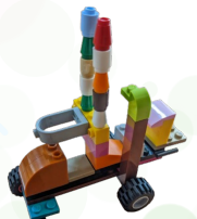
貝殼杉 - 簡子凌 車子