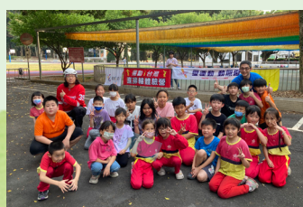
運動：台灣 直排輪體驗營活動