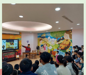
四年級 圖書館利用教育