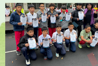
國小世界盃 足球晉級全國賽