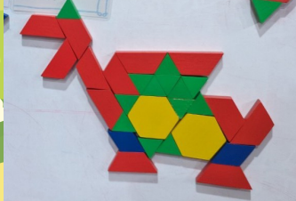
鹿角樹 - 陳俞汝 六形六色駱駝