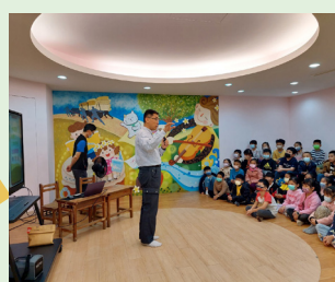
二年級 圖書館利用教育