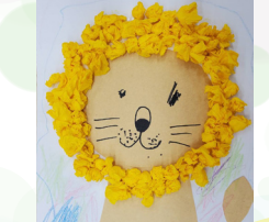
幸運草 - 游振興 獅子