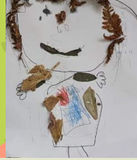
鹿角樹 - 劉彥伶 鬆散素材自畫像