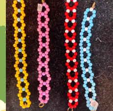
鹿角樹 - 徐鈺嫻、劉彥伶 串珠手鍊