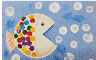
幸運草 - 陳薇羽 小魚游啊游