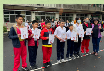
113 年中小學 聯合運動會射箭頒獎