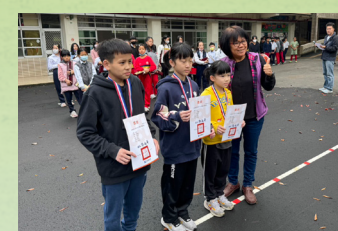
113 年中小學 聯合運動會羽球頒獎