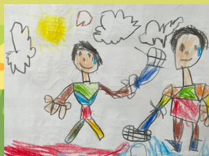
油桐花 - 潘亞倫 和祐佑打羽球