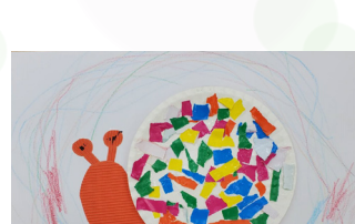
幸運草 - 游承翊 小蝸牛