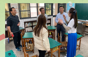
112 學年度下學期班 親會