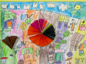
油桐花 - 黃芊頤 摺紙創意畫