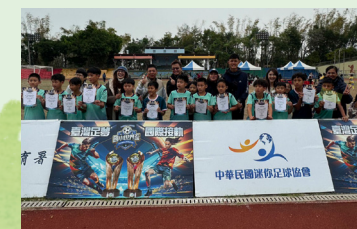
國小世界盃 足球南投賽