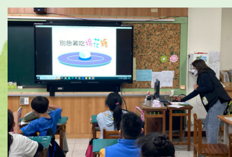
彩虹媽媽生命教育