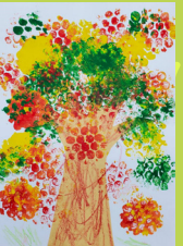
幸運草 - 黃珞涵 大樹

智慧源於勤奮，偉大出自平凡。我們人的智慧是靠勤奮所得，只有努力學習，才能有一定的知識，我們從小就要認真的學習，認真上課，因為我們一生出來就要開始學習做很多事勤學習，真的很重要，所以我們要活到老學到老，為成為一個更好的自己而努力！