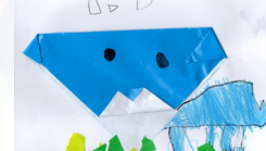
貝殼杉 - 林品言 摺紙小狗