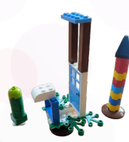
貝殼杉 - 黃子碩 飛機與燈塔