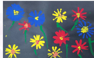
幸運草 - 全芊蓉 花海