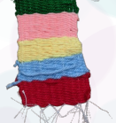
貝殼杉 - 林以軒 小桌布