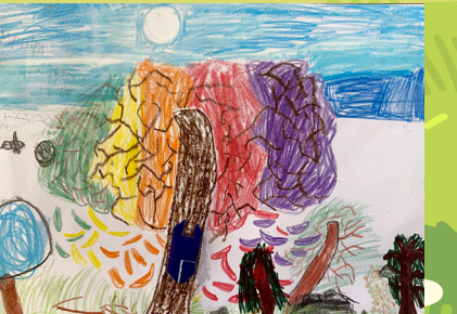
一丙黃鵬晉 - 奇妙森林