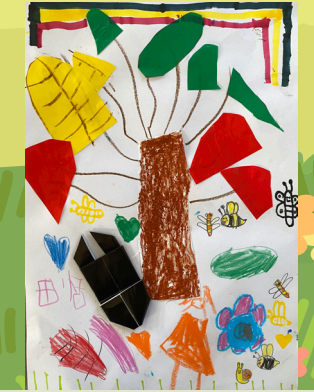
一丙周田恬 - 我的樹朋友