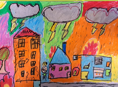
二乙涂恩誠 - 地震防災