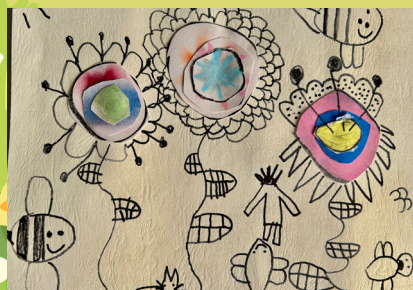
一乙張珈愷 - 拼貼畫