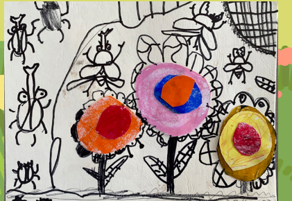
一丙范景綸 - 花花世界