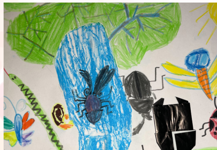
一甲陳佑澤 - 昆蟲樂園