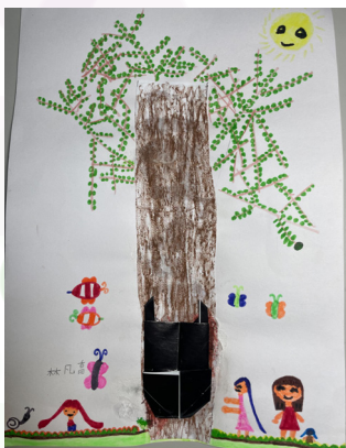
一甲林凡喬 - 找昆蟲趣