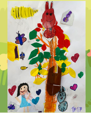
一丙陳瓊伊 - 我的樹朋友