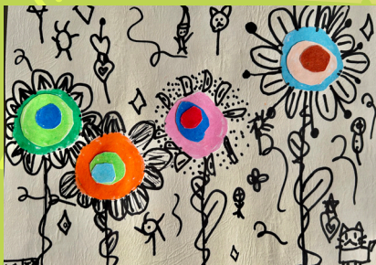
一乙林芷筠 - 拼貼畫