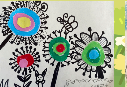
一丙恩雅 - 羅勃 - 花花世界