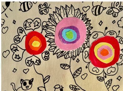
一乙張譯心 - 拼貼畫