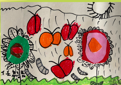
一乙任亭語 - 拼貼畫