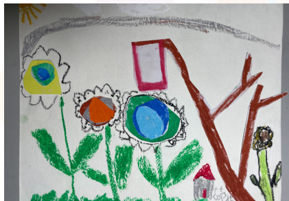
一甲茹仕東 - 快樂花園