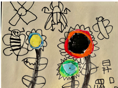
一乙羅品昇 - 拼貼畫