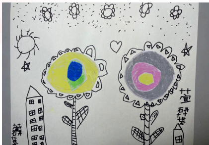
一甲葉研萱 - 花花世界