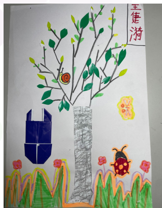
一甲王捷瀚 - 昆蟲花園